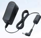
Adaptateur secteur BC-123SE