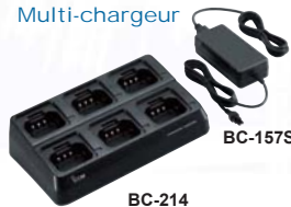
BC-214 Chargeur rapide 6 postes ou batteries